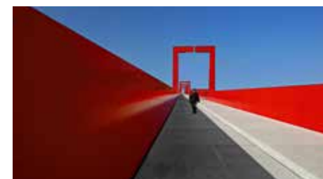
Perspective rouge

Du 1 er mars au 1 er avril. 24 h sur 24.